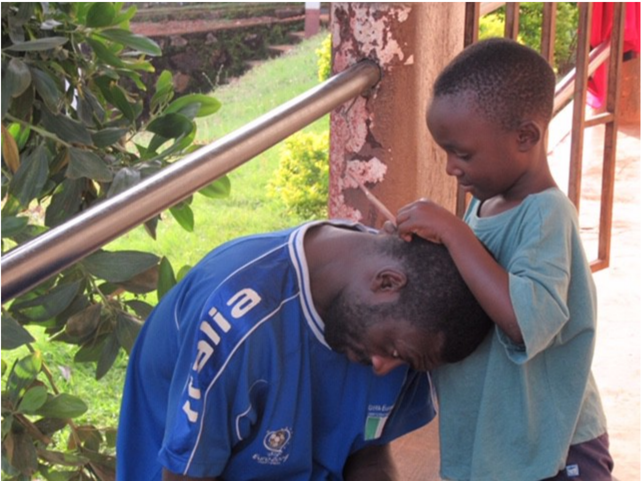
Diesmal andersrum : Läusescreening Sohn-Vater