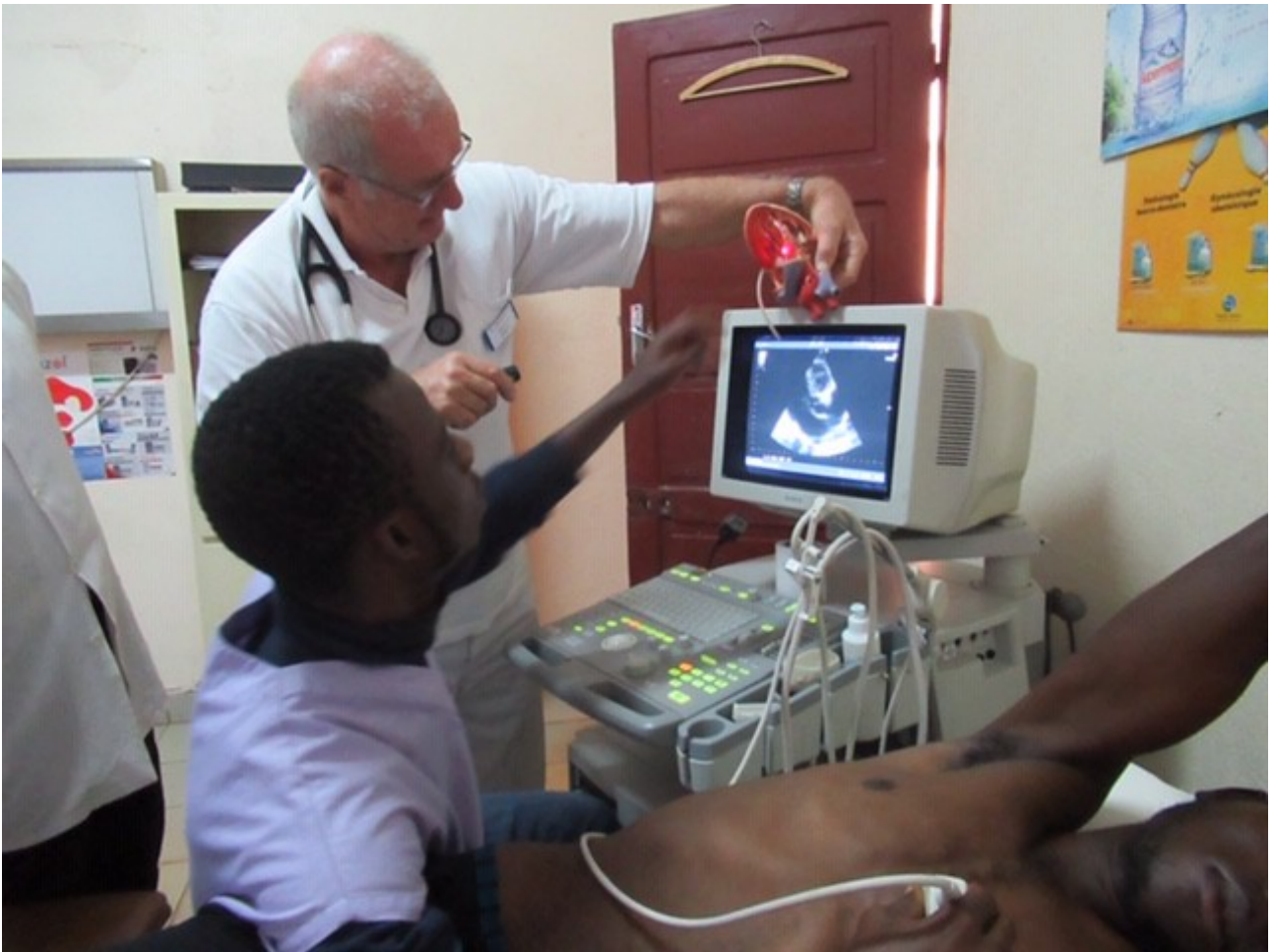
Herzecho mit Modell