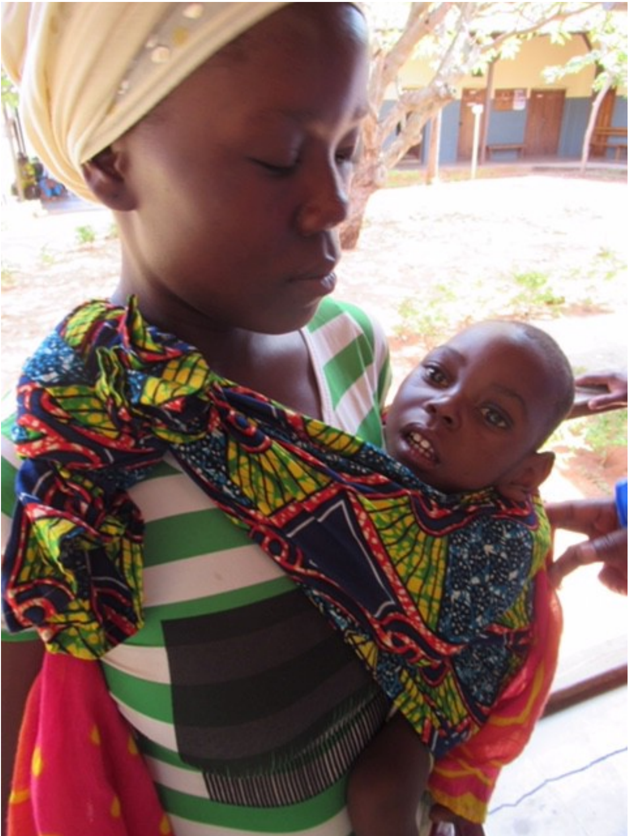
2 Jahre, 6 kg : Mangelernährung - Magenausgangsstenose beim Kleinkind